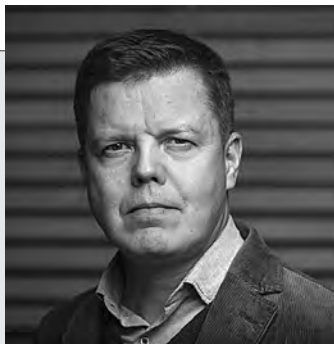
Народний депутат Андрій ОСАДЧУК.

Ми вистояли, а для руху вперед маємо засвоїти попередні уроки